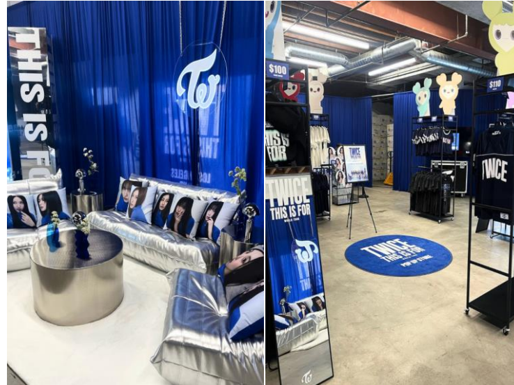
▲ TWICE <THIS IS FOR> POP-UP in LA

▼ STRAY KIDS DIGITAL (PLATFORM) ALBUM 'DO IT' SPEAKER VER.